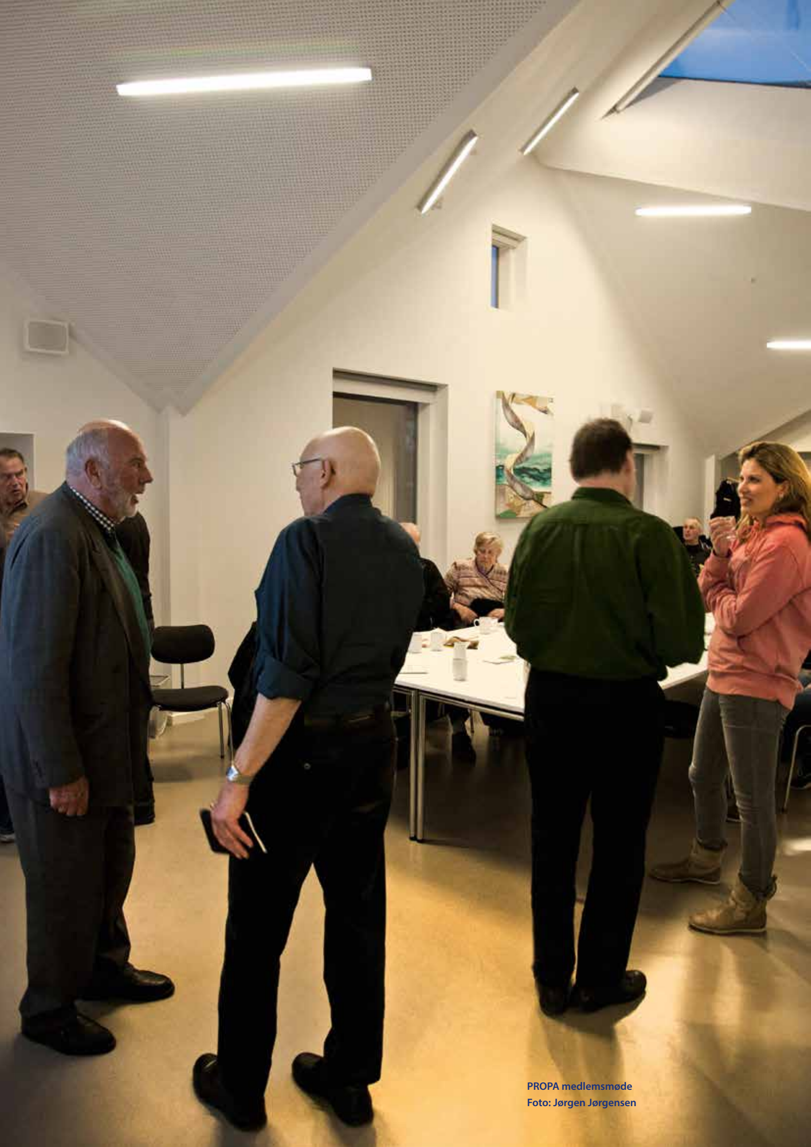
PROPA medlemsmøde