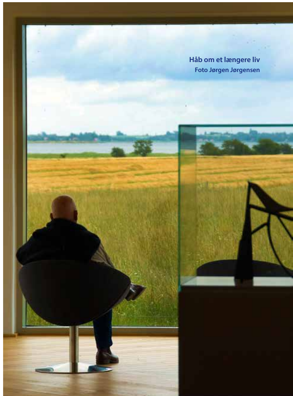
Håb om et længere liv

levede 13,6 måneder længere end de patienter, der kun fik ADT (median overlevelse 57,6 mdr. versus 44,0 mdr.). Behandlings-effekten var mest tydelig hos patienter med mere fremskrednen og udbredt metastasering, hvor overlevelsesgevinsten ved den kemo-hormonelle kombinationsbehandling var særlig markant med en forskel i median overlevelse på 17 mdr. (median overlevelse 32,2 mdr. versus 49,2 mdr.). Hos patienter med mindre udbredt metastasering fandtes også længere overlevelse, om end denne forskel ikke var statistisk